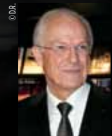
Alain Lambert Président du Conseil général de l'Orne

« S'il est un symbole élégant et tonique de l'excellence ornaise, c'est bien le cheval. En ce domaine, l'Orne joue dans la cour des grands, qu'il s'agisse d'entraînement, d'élevage ou d'infrastructures, sans parler naturellement de nos performances sur les plus grands hippodromes. Les chevaux ornaï occupent régulièrement la première marche des podiums les plus prestigieux.