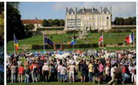
En septembre 2011, le Haras national du Pin a accueilli le Mondial Percheron.