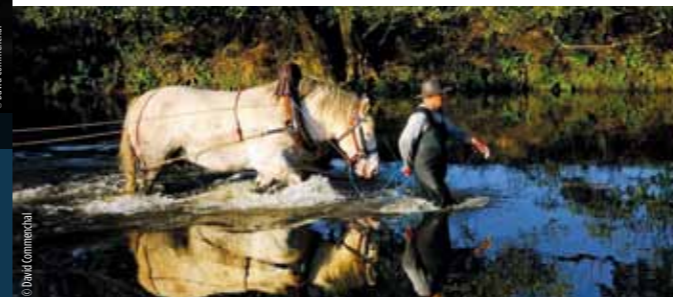
Le percheron est de nouveau un travailleur recherché : débardage, maraîchage, viticulture... Il devient aussi un cheval des villes à l'heure du développement durable.

Le percheron est de nouveau un travailleur recherché. Cheval des champs, du débardage en forêt, du maraîchage et de la viticulture, le percheron devient un cheval des villes à l'heure du développement durable : transport d'élèves et de touristes, collecte des déchets, brigades de surveillance équestres, entretien des espaces verts. L'avenir de la race repose aussi sur le développement de ces multiples utilisations.